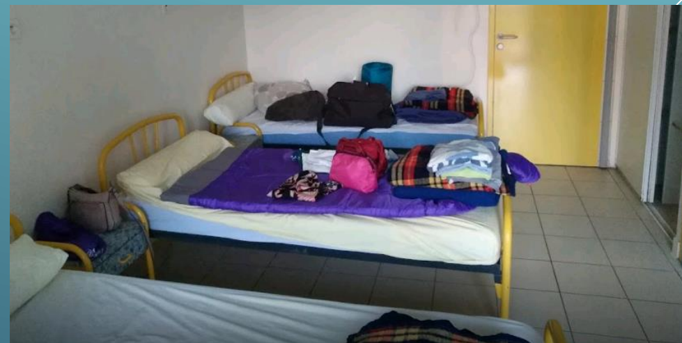
CENTRE LES COURLIS NOTRE DAME DE MONTS